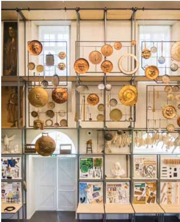
Accessoires et éléments de fabrication de la Comédie-Française

Il n'est pas nécessaire de maîtriser toutes les notions avant votre venue mais d'y être sensibilisées avec l'objectif d'inciter aux questionnements sur les grands thèmes rencontrés.