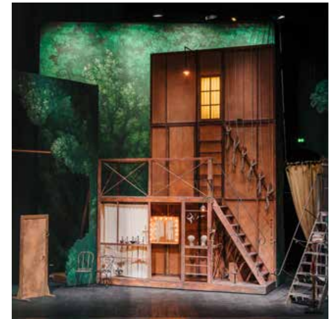
Éléments de décors de Cyrano de Bergerac par Éric Ruf, Comédie-Française, Paris, 2006

Le visiteur est conduit par une voix enregistrée, donnant la terminologie et fonctionnement des éléments expliqués, tandis que des halos de lumière l'incitent à se déplacer et à diriger son regard au fil des explications.