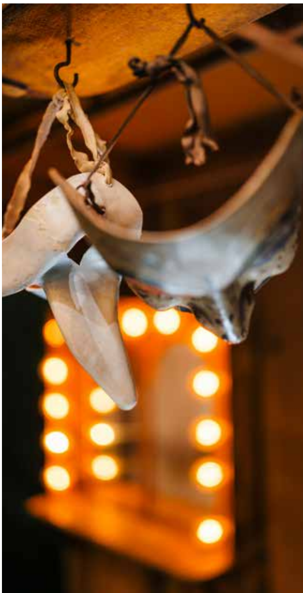
Détail du décor de Cyrano de Bergerac par Éric Ruf, Comédie-Française, Paris, 2006 Informations pratiques I p.24 - © Nicolas Anglade