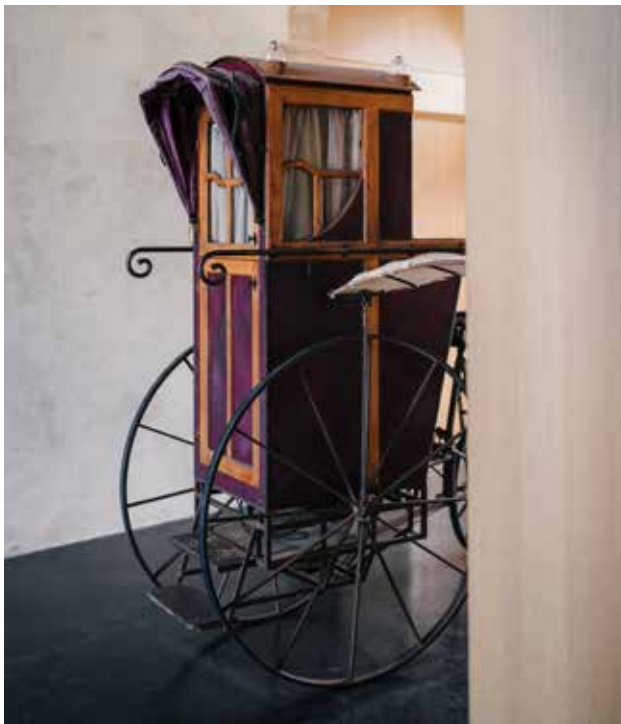
Détail du décor de Cyrano de Bergerac par Eric Ruf, Comédie-Française, Paris, 2006.