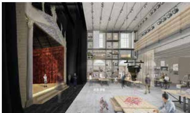
© ATELIERS ADELINE RISPAL, architectes scénographes

Ce deuxième acte montre le passage du projet artistique conçu par le scénographe à la concrétisation en volume, soit en d'autres termes, de la maquette à la réalisation du décor en trois dimensions.