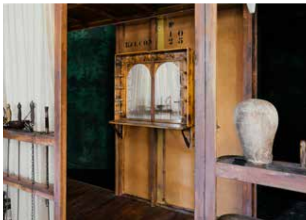
Détail du décor de Cyrano de Bergerac par Éric Ruf, Comédie-Française, Paris, 2006.

La visite de La Scène complétera ces enseignements ou viendra comme un aboutissement ou pourquoi pas aussi comme point de démarrage.