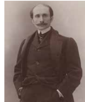
M. Rostand. Homme de lettres : [photographie, tirage de démonstration] / [Atelier Nadar] Source gallica.bnf.fr / Bibliothèque nationale de France

Cette pièce a la particularité de compter de très nombreux personnages d'horizons variés mettant en lumière entre autres des corps de métiers divers : bourgeois, marquis, mousquetaires, tire-laine, pâtissiers, poètes, cadets, Gascons, comédiens, pages, enfants, soldats espagnols, spectateurs, précieuses, religieuses, gardes, musiciens, etc.