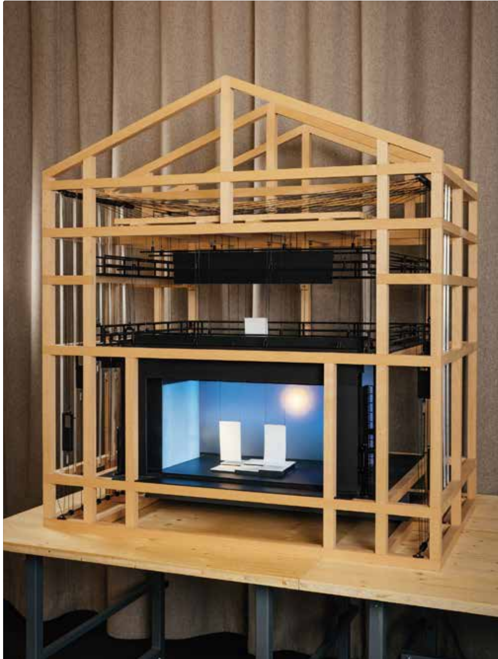
Maquette cage de scène conçue par REAS-PL. - Philippe Lacroix