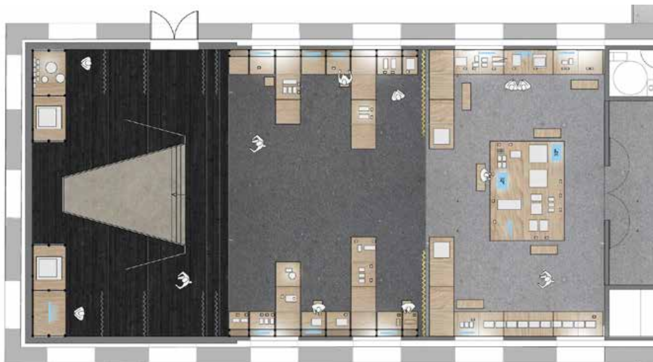
Avant-projet La Scène © ATELIERS ADELIN RISPAL, architectes scénographes

Dans une approche pédagogique et immersive, les différents savoir-faire se conjuguent pour donner vie à une scénographie. De nombreux objets - croquis, dessins, maquettes de décors en volume, plans, accessoires, outils, échantillons de matériaux divers, extraits et entretiens audiovisuels - en provenance d'institutions ou de compagnies théâtrales, de maisons d'opéras, nationales ou en région, d'écoles de formation, donnent les clés de compréhension et de découvertes de ces métiers peu connus du public. Pour rendre encore plus sensible la découverte de ce qui compose la scénographie d'un spectacle, un focus sur une création théâtrale est ici présentée grâce à la collaboration de la Comédie-Française. Éric Ruf , administrateur de la Comédie-Française et scénographe, a accepté de présenter son travail pour la pièce d'Edmond Rostand, Cyrano de Bergerac , mise en scène par Denis Podalydès à la Comédie-Française en 2006. Dans ce décor à taille réelle, le visiteur devient acteur et foule les planches d'une scène de théâtre et en découvre même les coulisses !