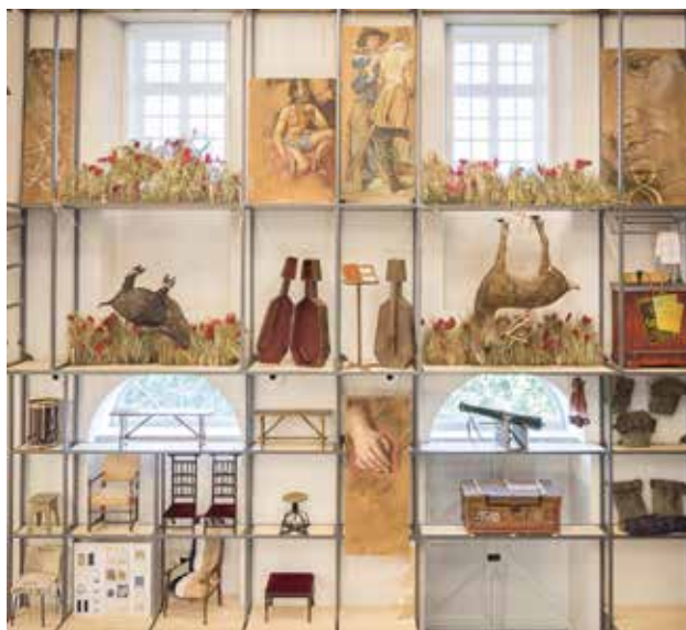
Accessoires de Cyrano de Bergerac , Comédie-Française, Paris 2006 © ATELIERS ADELINE RISPAL, architectes scénographes

Sur les tables, des objets sont mis à disposition du public pour manipulations et découvertes d'éléments tout comme quelques mots de vocabulaire spécifique.