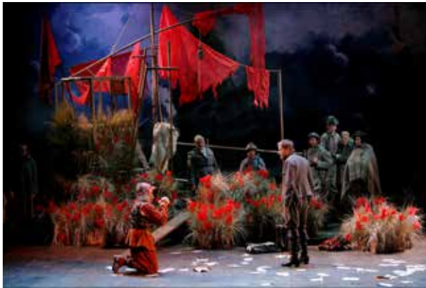
Cyrano de Bergerac par Éric Ruf, Comédie-Française, Paris, 2006