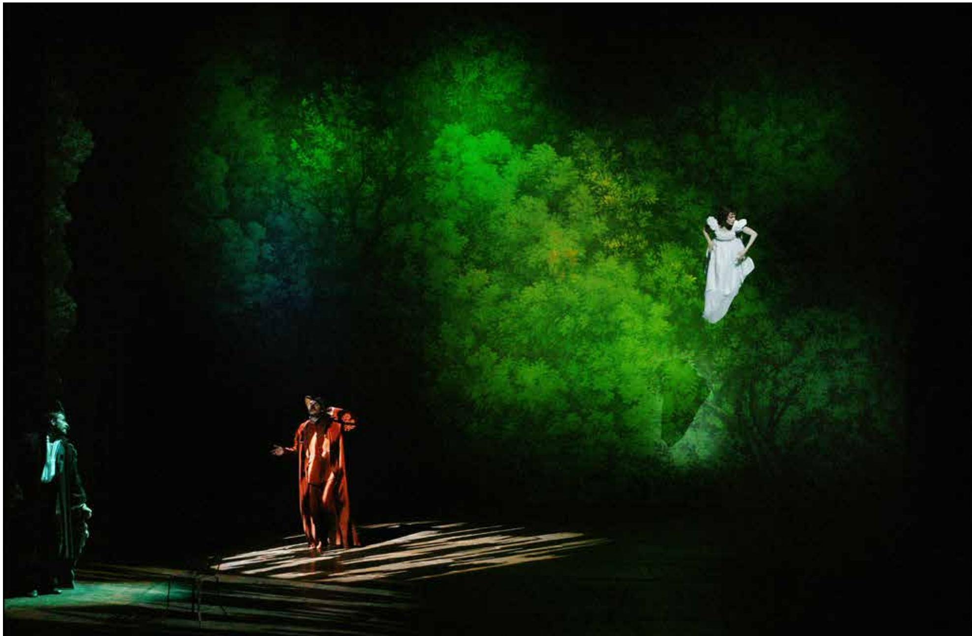
Cyrano de Bergerac par Éric Ruf, Comédie-Française, Paris, 2006