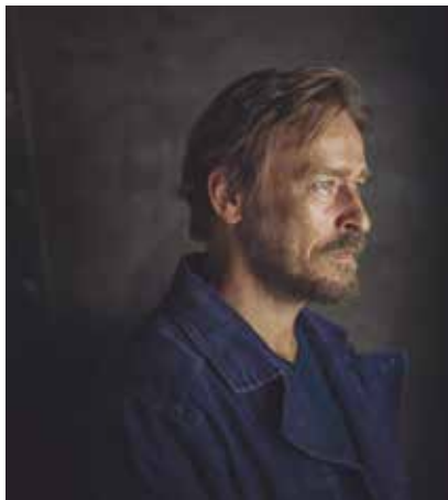
Éric Ruf administrateur Comédie-Française

La Comédie-Française compte trois salles : la Salle Richelieu, le théâtre du Vieux-Colombier et le Studio-Théâtre.