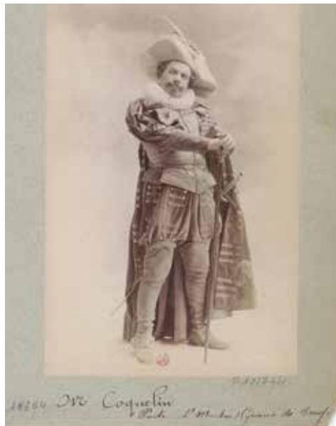
M. Coquelin. Porte Saint- Martin. Cyrano de Bergerac : [photographie, tirage de démonstration]