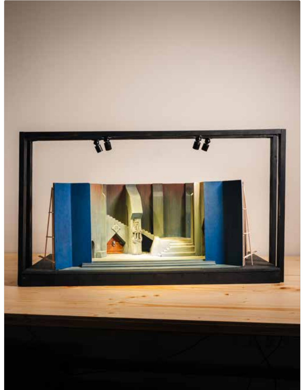
Hamlet, Théâtre de l'Avenue, Paris. Réalisé d'après la maquette originale de Gaston Baty conservée à la BnF