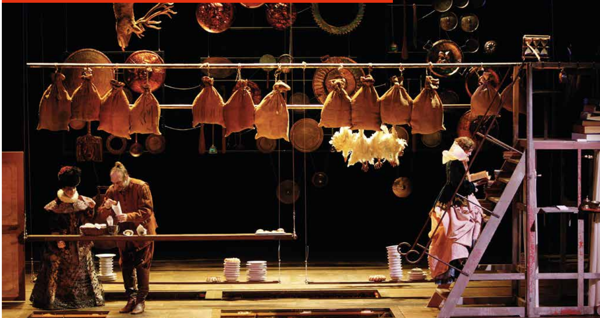
Cyrano de Bergerac par Éric Ruf, Comédie-Française, Paris, 2006