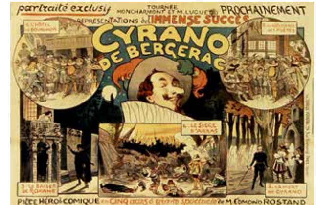
Tournée Moncharmont et M. Luguet, prochainement Cyrano de Bergerac : [affiche] / [Lucien-Marie-François Metivet]

Parmi ses œuvres, on trouve aussi Le Pédant joué , composé en 1645 ou 1646. Cette comédie en cinq actes et en prose est librement inspirée du Chandelier , de Giordano Bruno, dont une traduction est parue en 1633. C'est une comédie