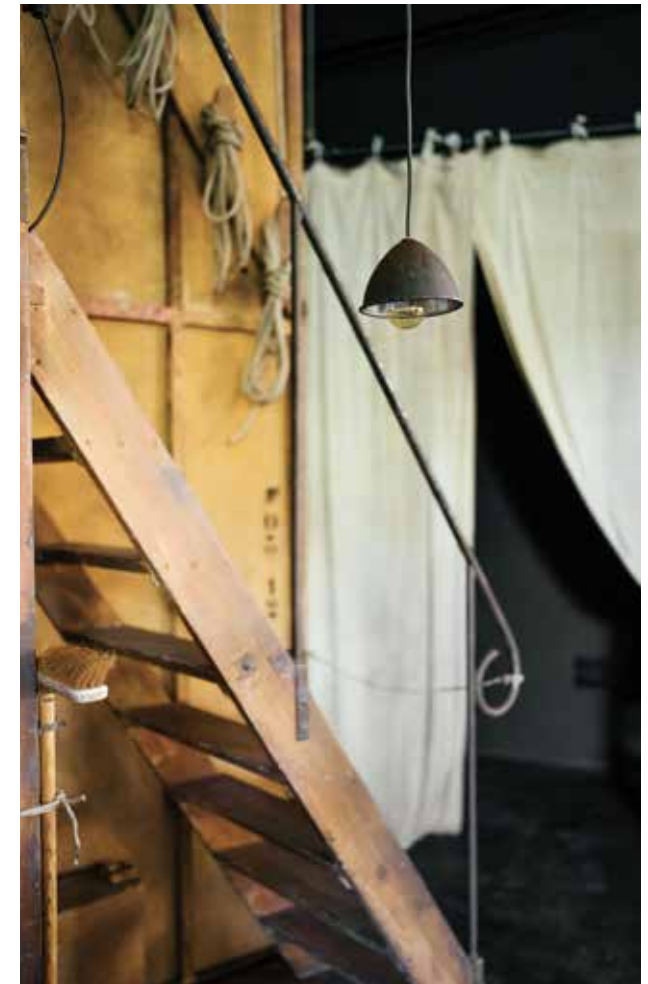
Détail du décor de Cyrano de Bergerac par Éric Ruf, Comédie-Française, Paris, 2006.

Français – Langues vivantes – Histoire des Arts – Arts plastiques